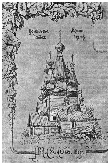
Фото 2а. Успенская (Казанская) церковь Илеменского погоста. XVII в. [Лебедев. 1915]

Между церквями, на изгибе р. Шелонь, находится почитаемый родник: ранее над ним стояла деревянная часовня; недавно на пожертвования местных жителей построена каменная, посвященная Параскеве Пятнице. «Священник у нас в Йлемне, в Йлемне там две церкви старинные. — Там вот даже часовенку восстанавливали, <...> там ключок был такой, коло старой церкви... — Там крыша вот так вот сделана, крестик, там четыре столбика и вот так крыша. И внутри там крестик стоит. — Это там святая вода. — А по завету туда ходили? — Да. По завету ходили вот эта пятница после Троицы. Ой, забыла на какой день. За-