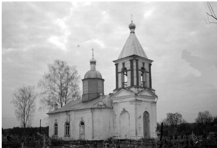
Фото 4. Успенская церковь в с. Молочково. 1815 г. Современный вид

Единственной сохранившейся и ныне действующей церковью является Успенская церковь, предположительно 1815 г. постройки [ИИМК ф. 2, оп. 2, д. 1738: 2 об.] в с. Молочково (фото 4), бывший Успенский монастырь, отмеченный с 1539 г.: «Деревня Молочково, церковь Успение Пречистые: двор игумен Корнилей, двор диак Захар, двор сторож Тимошка, двор проскурница Настасья» [НПК 1905: Стб. 501]. Центр прихода традиционно составляли церковь, часовня на окраине села и почитаемый источник.