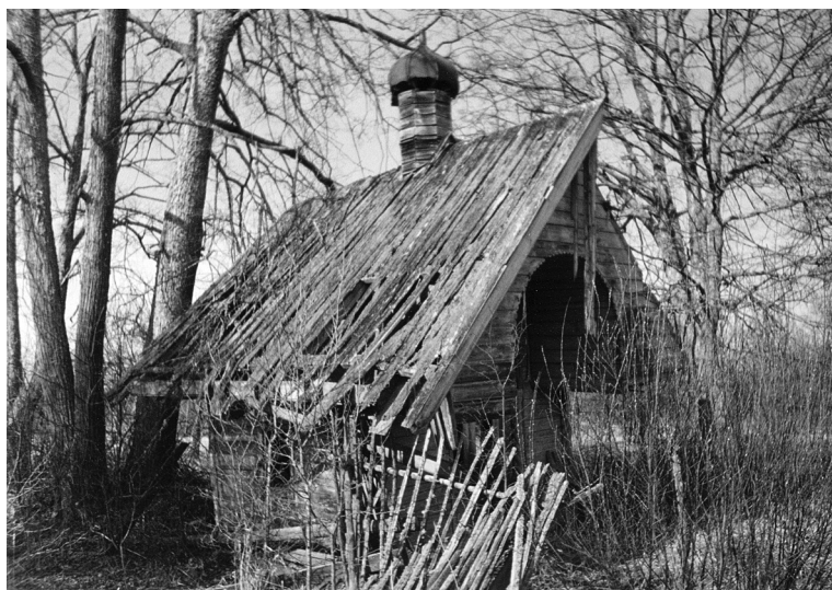
Фото 7а. Часовня в д. Софиевка (Высочка). Современный вид