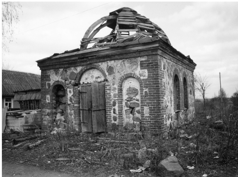
Фото 5. Часовня в д. Клин. 1904 г. Современный вид

тюшку когда привёдут, дак он отслужи...» [ПЗА 2002: д. Петровщина].