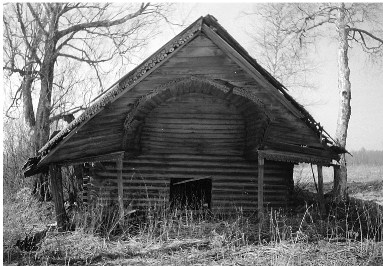
Фото 9. Часовня в д. Бараново над почитаемым родником. Начало XX в. Современный вид

мест почитание родника, которое начиналось в результате явления иконы.