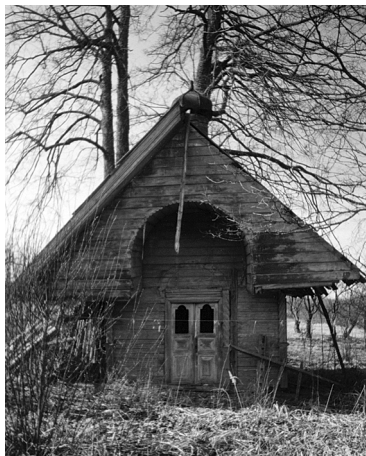
Фото 7. Часовня в д. Софиевка (Высочка). Современный вид

— Да, да, да. И вот он подпоил мужиков... А было часовенку у нас... В 807 [т.е. в 1907 году. — Е.П. ], написан, кто строил эту часовню? [Соб. 2 — Я думаю в 5-м, да там, наверно, видать сейчас.] — Не, думаю, доски обломавши. [Соб. 2 — Так не на досках было написано.] — Не, вот так было, доска стояла, и это, под крышей было. „Деревня Гремोक строил“ вот в этую. Раньше вот эту часовню построил и люди вот, наши мамы, меняли картошку и зерно и всё, чтобы купить иконку, и туда поставить иконку. Там был така красота! Вот в два ряда, а где поменьше и в три. Стены были все в иконах, от полу до потолка. И купол был, и была поставлена така как плащаница, ну как кровать, с ножкам, всё точеные, выносить покойника. И подсвешник. Всё было придуман-то не нашим дурацким головам! А всё у людей-то у хороших, и сделан-то всё из дерева, и всё обточено, и всё выточено, и всё красота! Умрет покойник, не надо дома, что семьи, а вынес в этую, зажог свечечки и посидел, надо — пошел домой спать, закрыл. А здесь... Тоже коммунисты, захотел разрушить эту часовню, купил вина