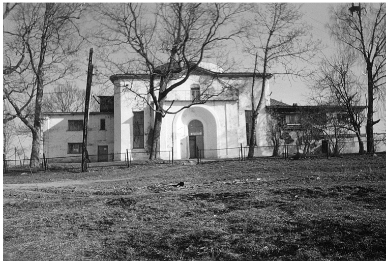
Фото 3. Ретенская Никольская церковь. Середина XIX в. Современный вид

ветный праздник был в Илемне, вот там на ключок ходили. На Шолонь ходили и на ключок. Ключок — там всё время вода была» [ПЗА 2002: д. Клинь].