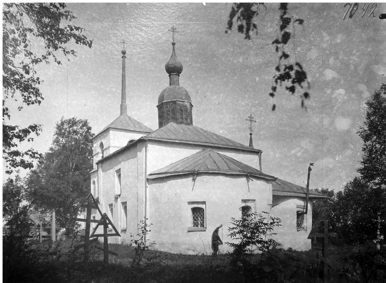
Фото 1. Введенская церковь Шкнятинского погоста. Фотография начала XX в.

колхозных дворов. До нашего времени сохранилось и продолжает функционировать кладбище, имевшееся при церкви.