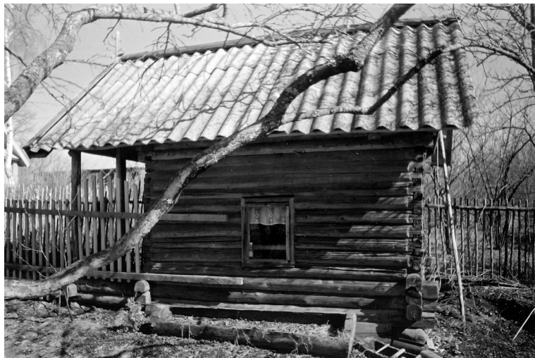
Фото 6. Часовня в д. Витебско. Современный вид

д. Клинь]. Согласно дате, выбитой на стене часовни, возведение ее относится к 1904 г.