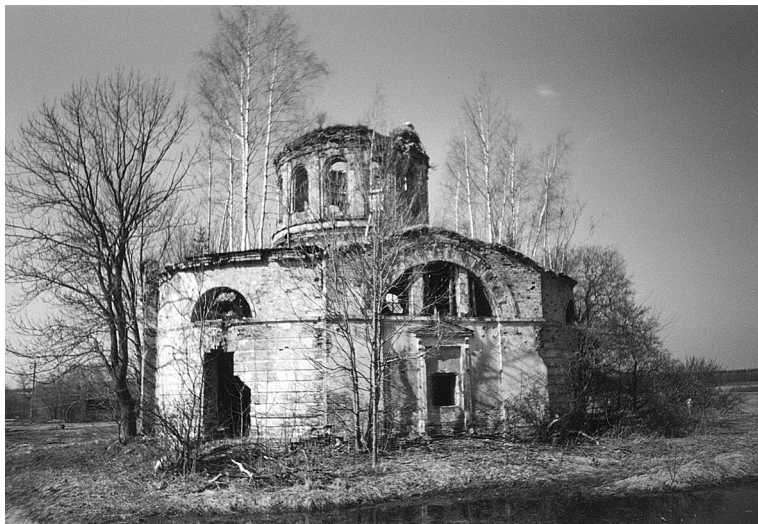
Фото 2. Сергиевская (Успенская) церковь Илеменского погоста. 1842 г. Современный вид

сейчас поставили под горой, кака-то часовенка. А там-то когда церковь было каменная, такая красотища было — на берегу Шолони, березы стояли, сколько людей туда ходили. Я помню это, ходили всё, скамеечки всё поставлено было — красота было, красота» [ПЗА 2002: д. Городище].